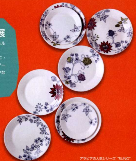
アラビアの人気シリーズ「RUNO」

アラビア社は世界的に有名なフィンランドの陶器メーカー。1873年、ヘルシンキ郊外の別荘地に誕生した北欧最大の窯です。 このアラビアの人気シリーズ「ルノ」を手掛けたのが、若手作家のヘイニ・リータフタ。ヘルシンキ大学在学の間から注目され、現在アラビア・アート・デパートメントに所属しています。シンプルなフォルムに色鮮やかなデコレーション。 ヘイニの世界に、直接触れてみませんか。